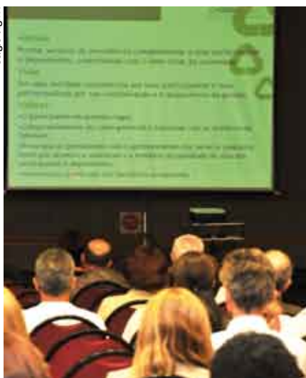
Público acompanha prestação de contas