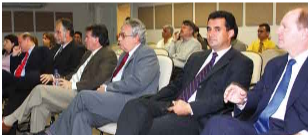
Auditório foi inaugurado com evento dos 30 anos da Fusesc