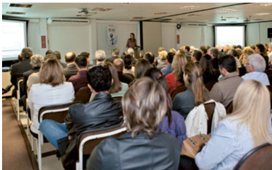
Lançamento reuniu público de 13 fundos de pensão

Programa Integrado de Educação Financeira e Previdenciária