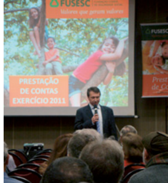
Última reunião foi em Florianópolis

A prestação de contas regionalizada já está incorporada ao calendário da Fusesc. É uma atitude que visa a promoção da transparência da gestão dos planos e a aproximação com os