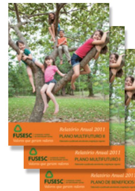
RENTABILIDADE POR PLANOS EM 2011 (%)

Quem desejar uma cópia impressa do relatório do seu plano pode solicitar à Central de Atendimento por e-mail, telefone ou pessoalmente.