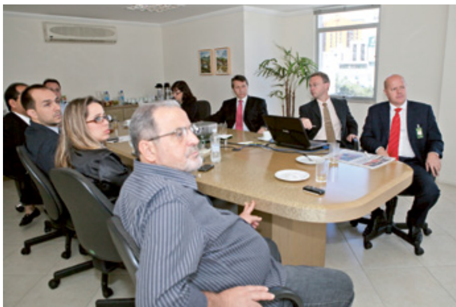
Jornada iniciou com apresentação para as patrocinadoras

Os eventos visam à promoção da transparência e a aproximação com os participantes.