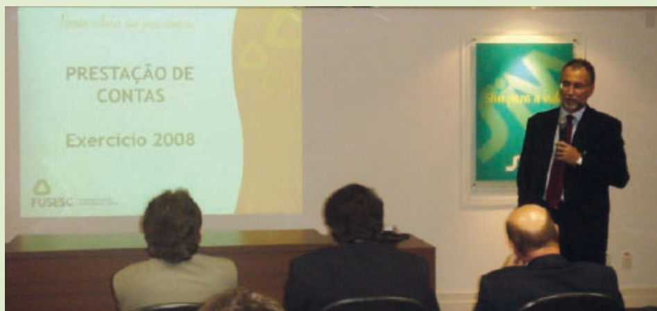
Reunião com patrocinadoras deu início à rodada de prestação de contas que percorre o estado

as obrigações do fundo de pensão e um banco de dados com a classificação dos participantes por sexo, idade e salário, por exemplo.