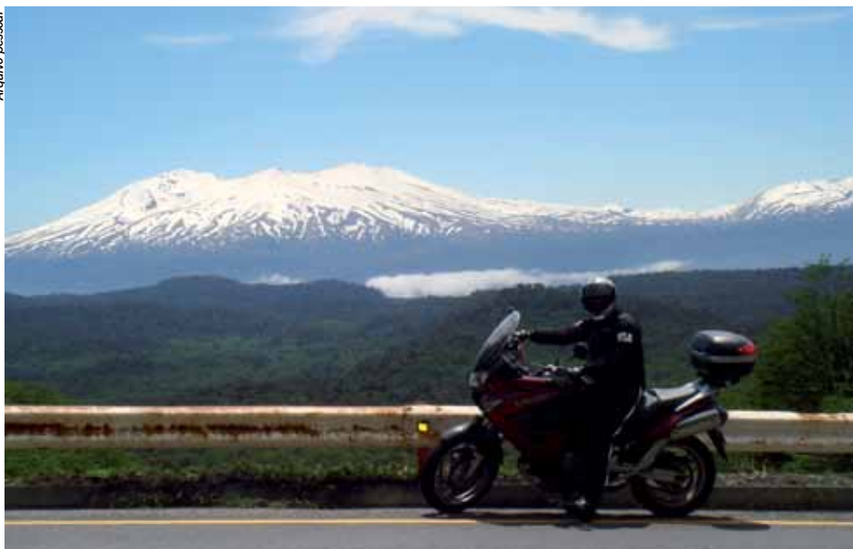
O participante Hélio César Gama do Nascimento em viagem que fez de moto até o Chile, em novembro de 2008