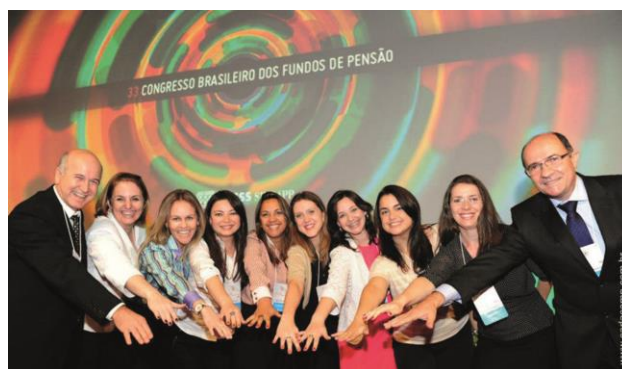
Profissionais dos fundos de pensão integrantes da Comissão do programa

O programa A Escolha Certa foi idealizado pelas entidades que integram a ASCPrev – BFPP, CASANPREV, CELOS, DATUSPREV, ELOS, FUMPRESC, FUNESC, OAB Prev-SC, QUANTA, PREVIG, PREVISIC, PREVUNISUL e WEG.