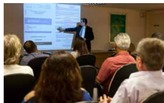
Comissão apresentou detalhes do processo eleitoral para entidades representativas de participantes e assistidos.