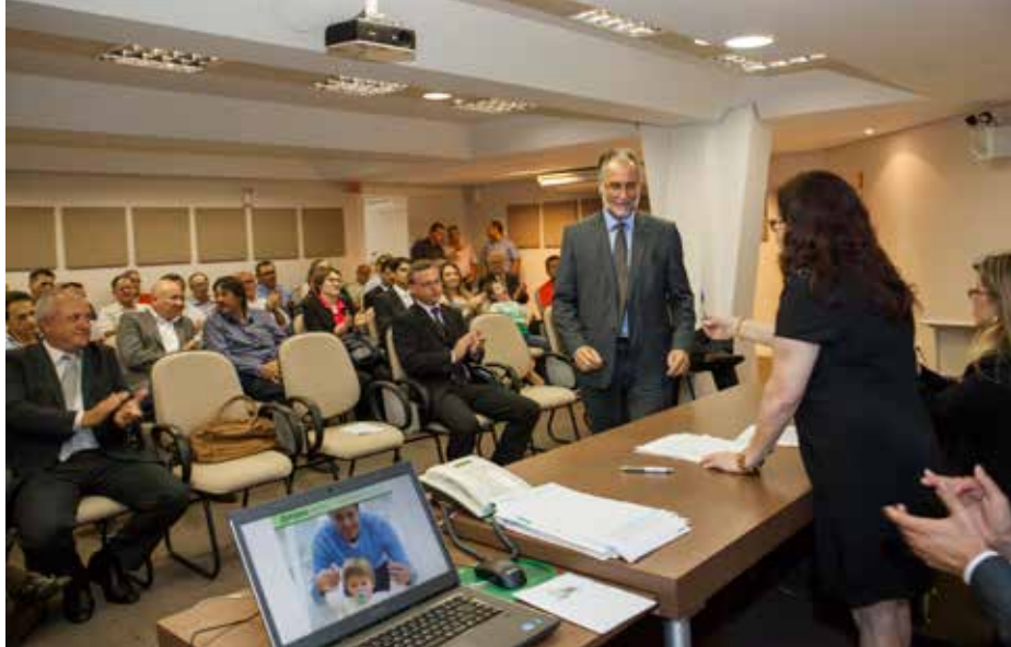
Novo superintendente assinou o termo de posse.