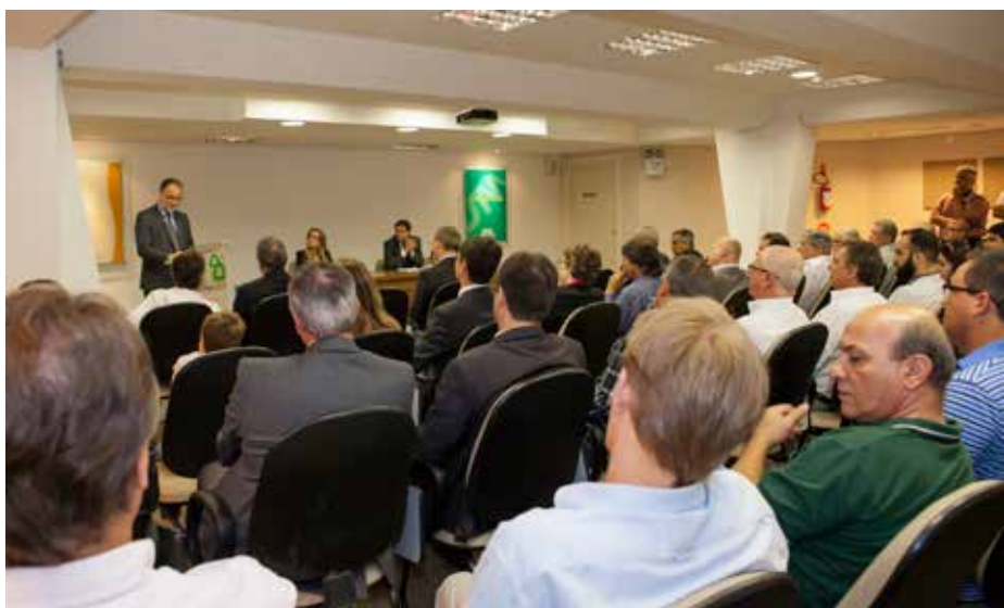
Auditório da Fusesc ficou lotado para solenidade.