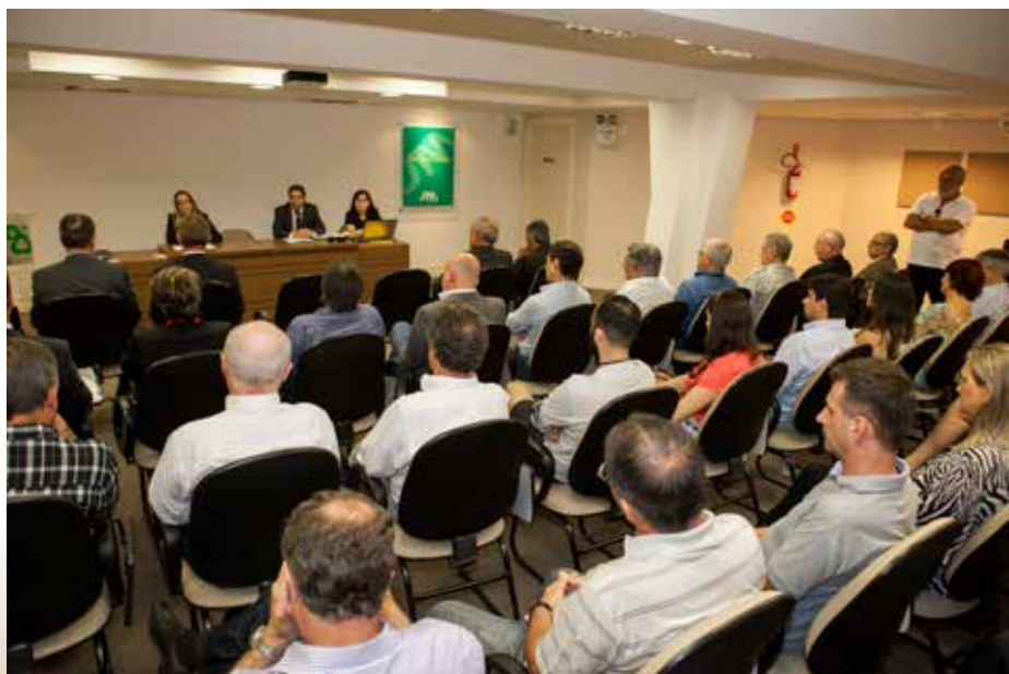
Participantes, assistidos e familiares dos empossados prestigiaram o evento.